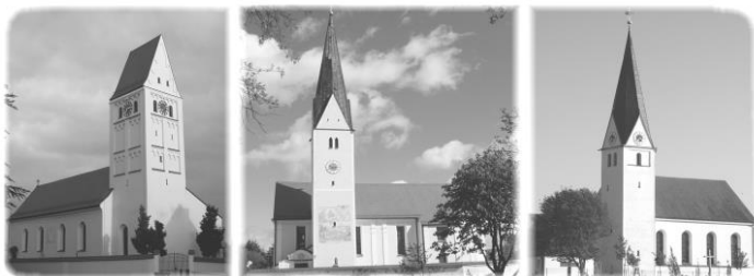
St. Margareta Hohenried