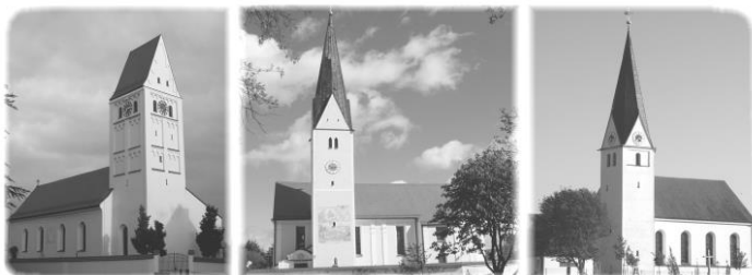
St. Margareta Hohenried